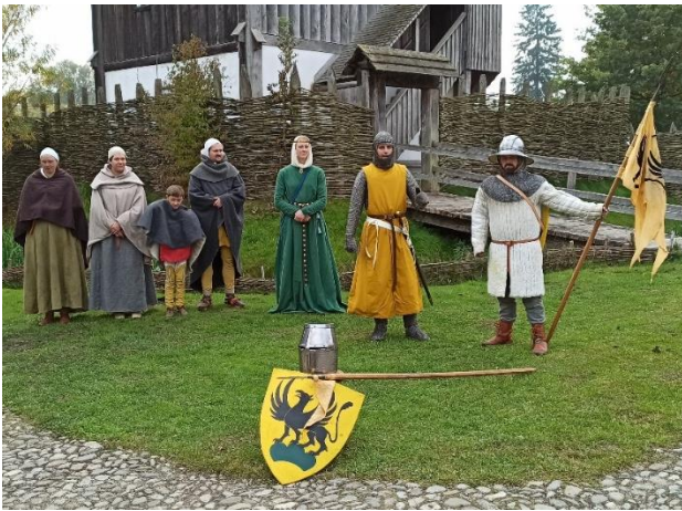
Living-History-Gruppe „Grifenstein 1270“

Demnächst startet die Bachritterburg in ihre mehrmonatige Winterpause. Im kommenden Jahr soll es dort dann mit einem abwechslungsreichen Kulturprogramm weitergehen.