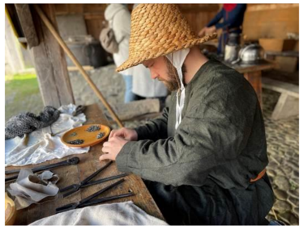
Historische Kettenhemdherstellung – ein Sarwürker bei der Arbeit